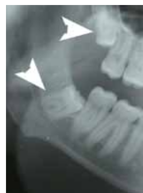
▲ 埋伏している親知らずの画像

多くは外来で局所麻酔のみで抜歯できますが、深く埋伏している場合は全身麻酔下に行うこともあります。