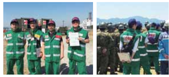
▲訓練等に積極的に参加しています。

このように、日頃から楽しく体を動かしてリフレッシュするとともに、DMAT出動時には、過酷な活動にも耐えられるよう鍛錬しています。