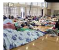
▲熊本地震時の出動隊員と避難所風景

は、医師1名、看護師2名、ロジスティック（業務調整員）1名で構成されたチームで、私はロジスティック隊員として活動しています。