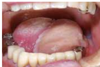
▲ 前腕皮弁での舌の再建術後

口腔がんの多くは、痛みがない潰瘍として現れますが、多くはその前に白板症という白色の病変が先行します。なかなか治らない口内炎と勘違いし、大きくなって歯科医院を受診する方が非常に多く見受けられます。口腔がんの治療は、補助的に放射線治療、抗がん剤治療を行うこともありますが手術が中心となります。小さい病変の場合は切除後縫い合わせるだけですむこともあります。大きい病変を切除した場合、他の部分を移植して再建することが必要になります。