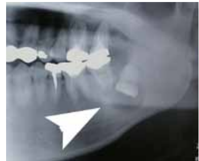
▲ 埋伏歯を中心に嚢胞が認められる画像