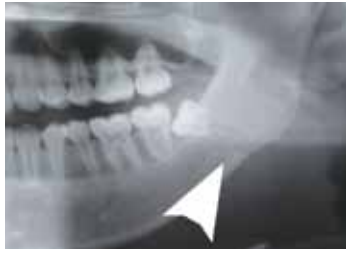
▲ 顎の骨折が認められる画像