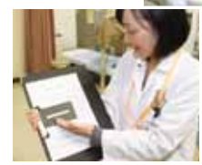
▲（上）正確な検査結果が出るよう努めています。（左下）見難い患者さまのために手作りグッズの作成などを提案しています。