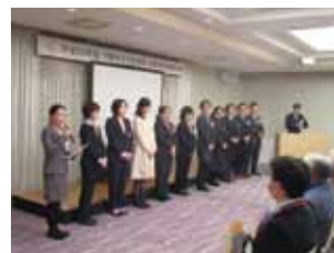
▲(上) 第1部の様子 (下) 認定看護師の紹介