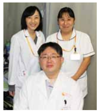
▲「優しく笑顔で」をモットーに、一丸となつて頑張っています。

また、歌うことが好きで、レッスンに通っています。今年、ライブに挑戦したいと思っています。