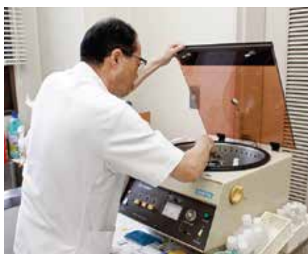
プレパラートに加工する様子

乳腺外科・病理診断科の医師・看護師・臨床検査技師・診療放射線技師の多職種で行われます。