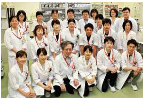
▲患者さまに正しく安心してお薬を使用してもらう「最後の砦」が薬剤部です。