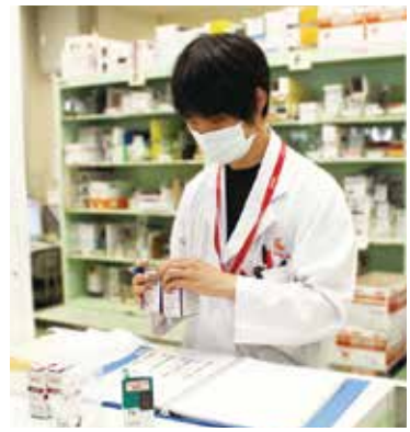
▲レジメン（抗がん剤を投与する計画書）と薬剤の監査作業

「薬剤師」と言えば、「薬を調合したり準備（以降、調剤）して渡す人」というイメージを持たれている方が多いと思いますが、それは業務のごく一部で、調剤・監査（ミスがないか確認すること）、服薬指導、抗がん剤・無菌製剤の調製、患者さま・医療スタッフへのお薬情報提供、薬品管理、入院時の持参薬確認、病棟薬剤業務など、多岐に渡る業務を行っております。 また、その他に委員会やチーム医療への参加など、それぞれに個別の業務なども行っています。