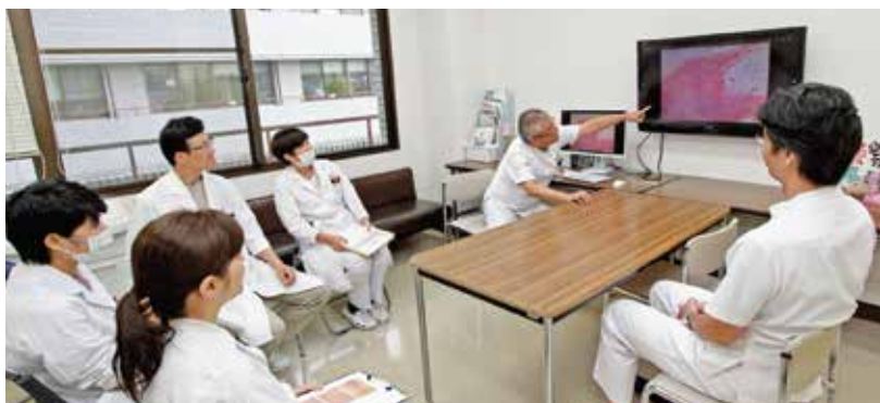
乳腺外科カンファレンスの様子

乳腺外科・病理診断科の医師・看護師・臨床検査技師・診療放射線技師の多職種で行われます。