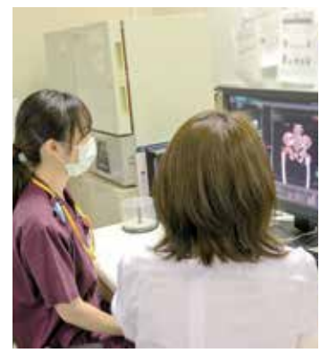
▲先輩からは時に優しく時に厳しく、丁寧な指導を受けています。

検査後に患者さまに「あなたに検査してもらえてよかった」と言われた時です。 日頃から患者さまの気持ちを思いやりながら検査をしています。それが伝わった時はとても嬉しいです。