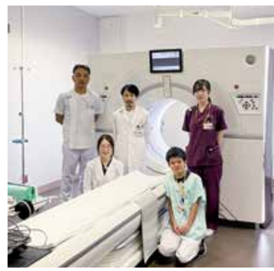
▲休憩時間などは冗談を言い合ったりする笑顔があふれる職場です。

ドライブです。免許を最近取得しました。近頃は気候も良くなってきたので、休日に色々なところに車で行けるのがとても楽しみです。