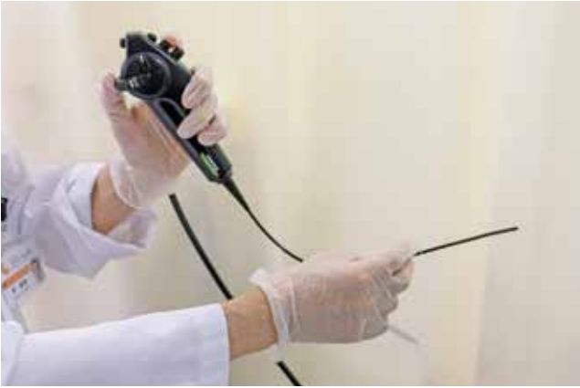
▲診療に使う内視鏡は直径が細くなり負担が少なくなりました。

特に内視鏡は鼻やのどに管を入れるので、痛かったり気持ちが悪かったりしますが、以前に比べ内視鏡の直径がずいぶん細くなっていますので、負担が最小限に抑えられるようになりました。鼻の中に内視鏡を入れても痛くないように、最初にキシロカインという麻酔薬をスプレーしますが、ごくまれにキシロカインアレルギーの方がいらっしゃいます。もし以前にキシロカインアレルギーといわれたことがあったら検査前に申し出るようお願いいたします。