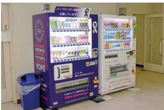
▲本館1階食堂前に設置してあるパープルリボン自動販売機

この自動販売機の売り上げの一部は、パンキャンジャパンに寄付され、活動に役立てられています。