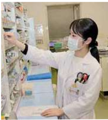
▲調剤業務では患者さまひとりひとりに適した形で調剤します。