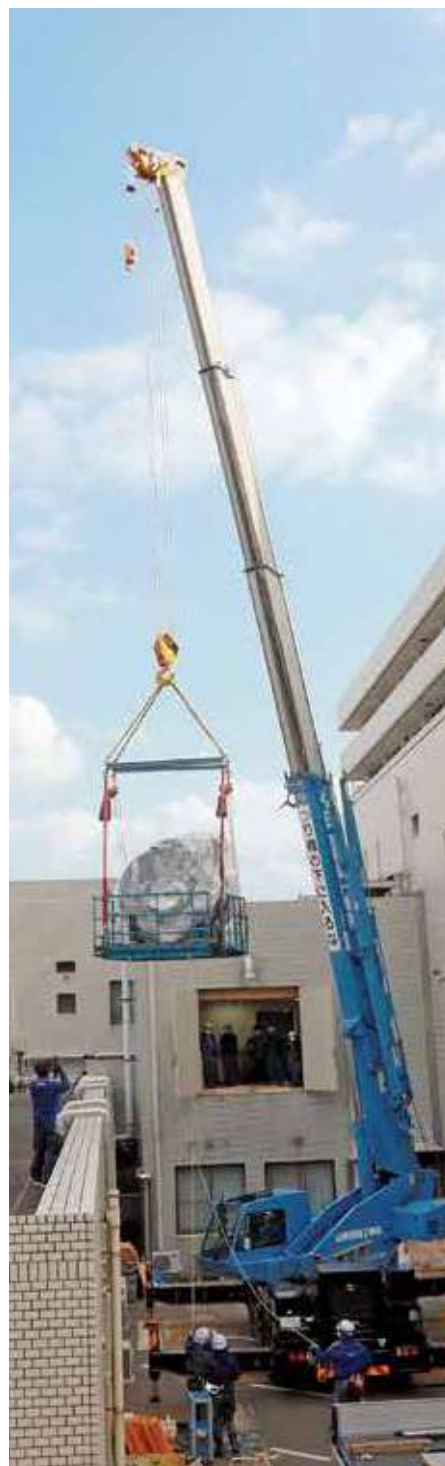
▲2023年12月3日、3T-MRI機器搬入の様子