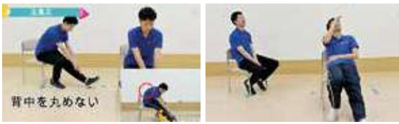
▲完成動画のワンシーン ▲なごやかな撮影現場

運動の動画は視聴される方に運動方法がわかりやすいように気をつけて撮影しました。また、音声は別に録音、編集したことで聞き取りやすくなつていいると思います。編集には、事務部職員が協力しています。