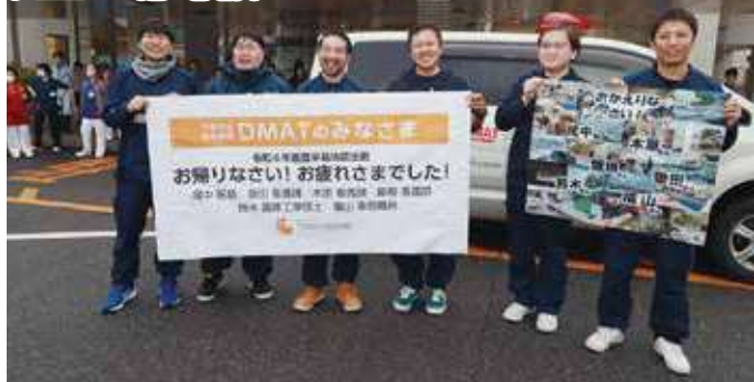
▲1月18日無事に帰着した隊員