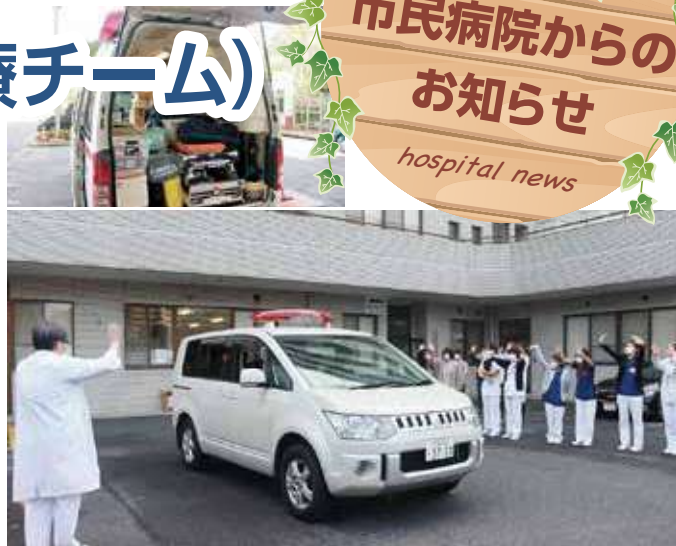
▲1月11日活動期間の物資、食料、寝袋などを積み込み、出立