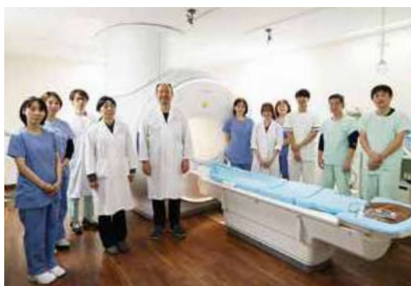
▲医師、診療放射線技師、看護師などの多職種で安全に検査を受けていただけるよう取り組んでいます。