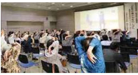
▲9月開催の市民公開講座開始前には、たくさんの方に体験していただきました！

視聴しながら運動できるように作成していますが、慣れてこられたら、視聴せずに、ご自分で回数や運動する曜日を決めて実践してみてください。1回の運動では効果が期待できないので、まずは3か月間は継続して頑張りましょう。