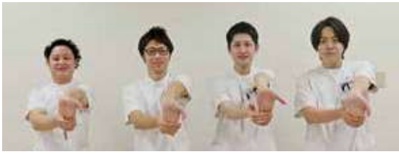
▲作成したリハビリテーション部理学療法士