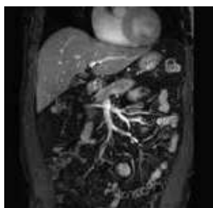
▲腹部冠状断像 腹部の呼吸性移動や腸管運動による画像ムラを抑制し、鮮明に描写できます。