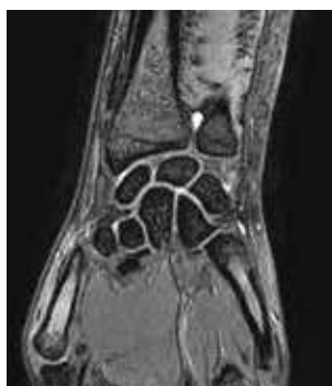
▲手関節 微細な構造も確認できます。