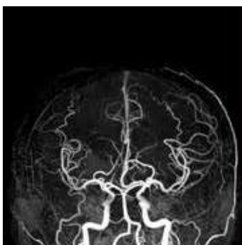
▲頭部MRA (脳血管画像) 末梢血管まで描出できます。