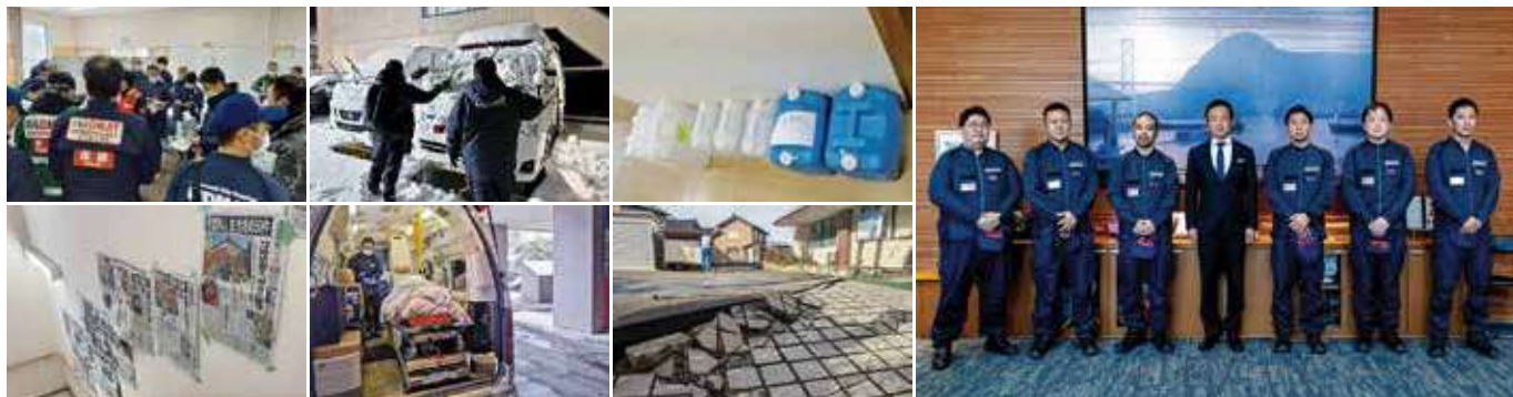
▲1月12日から1月17日までの6日間現地での活動を行い、帰着後の1月26日に下関市長に活動報告を行いました。