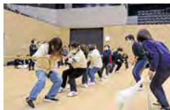
▲綱引き大会の様子

当院では「会員相互の親睦と福利の向上を図る」目的で看護部自治会があります。自治会では、部署や職種を超えたつながりを大切にし、親睦を深めることを目的に様々なイベントを企画・運営しています。感染症の影響で数年は活動を自粛していましたが、新人歓迎会などのイベントを再開し、盛り上がりを取り戻しつつあります。