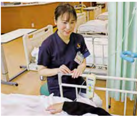
▲患者さまの思いに寄り添えるよう、日々の声かけや傾聴を大切にしています。

※認定看護師とは、ある特定の看護分野において、熟練した看護技術と知識を有する者として、日本看護協会の認定を受けた看護師をいいます。